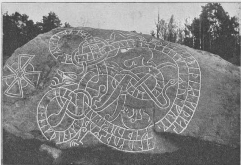
Fig. 5. Lingsbergsstenen 2.

Den nyfunna stenens inskrift — Lingsbergsstenen 2 — lyder: