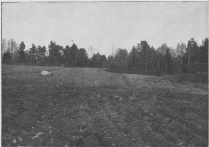
Fig. 2. Fyndstället från väster.

fyllningens djup kan man göra sig en föreställning däraf, att man vid åns reglering gått ned till 3 meters djup utan att hinna bankens botten. Öfver "bron" har den gamla vägen mellan Lingsberg och Kusta gått. Den nuvarande vägen löper ungefär 70 meter norr om den gamla, af hvilken också finnes en rest i en liten gångstig, som från åkerrenen på östra sidan om ån löper åt Kustahållet. Den bifogade kartan, som är ri-