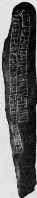
Fig. 7. Bjälbostenen.