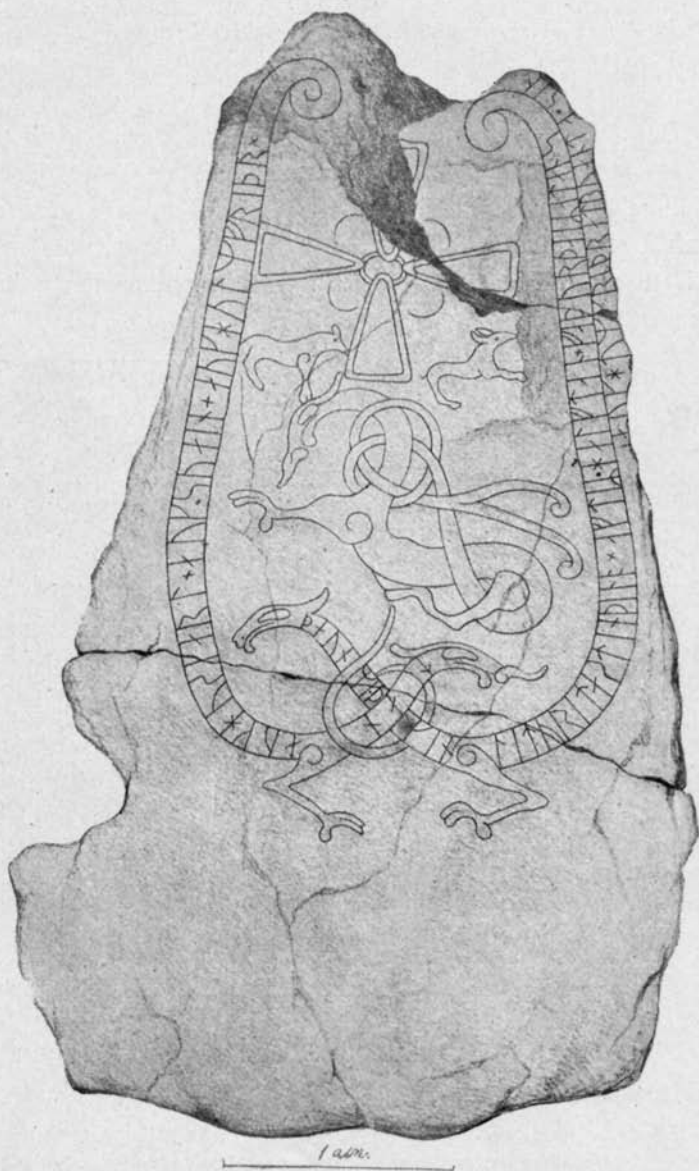
Fig. 4. Lingsbergsstenen 1. Efter Dybeck 8 vo .

nan har samma egendomliga form med en till slingans ramstreck icke nående hufvudstaf, som förekommer å systerstenen. Detta är angifvet å Dybecks första teckning i D 8 vo — där runan visserligen icke fått alldeles riktig form — men förbisedt i afritningen i D fol. 5 Hufvudstafven och öfre