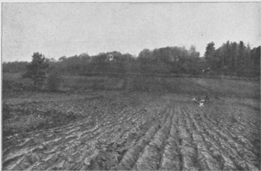
Fig. 1. Fyndstället från öster.

upp emot Lingsbergs gård, men har i senare tid blifvit betydligt sänkt och sjön slutligen helt och hållet aftappad. Längs afloppet för Kallbäcken har sålunda i gammal tid marken varit mycket sank och till följd däraf svårframkomlig. Men just där runstenarna äro funna mellan den på ett höjddrag liggande Lingsbergs gård och den rakt öster därom mot gården framskjutande berg- och moränmarken måste sankmarkens smala pass ha befunnit sig. I torf- och lerjorden, som längs